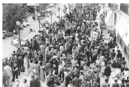
APÉRITIF DU 125 E ANNIVERSAIRE D'OMEGA AU FAIRMONT, LE MONTREUX PALACE

C'est du 17 au 21 juin 1973 que s'est tenu à Montreux, le 125 e anniversaire d'Omega. Avec plus d'un millier d'horlogers-bijoutiers venus du monde entier, ce fut le premier Congrès jamais organisé dans la maison des Montreusiens depuis son ouverture en avril de cette année.