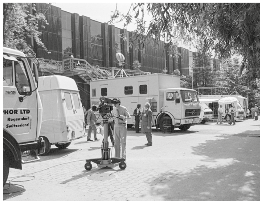
SYMPOSIUM INTERNATIONAL DE TÉLÉVISION, 1973

Montreux a toujours été défini comme l'endroit idéal pour la tenue de ce salon professionnel. Son offre hôtelière, sa facilité d'accès, au centre de la Suisse, son cadre exceptionnel et les prix de location des espaces d'exposition sont des arguments qui ont joué un rôle important dans le choix du lieu par les organisateurs et les professionnels. Cet événement restera à Montreux jusqu'en 2010.