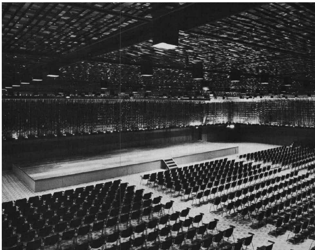
LA GRANDE SALLE DE LA MAISON DES CONGRÈS, 1973