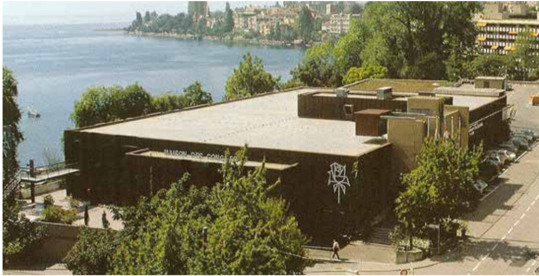
LA MAISON DES CONGRÈS ET SA 1 ÈRE EXTENSION, 1982

PÉRENNISER L'ACTIVITÉ TOURISTIQUE DE MONTREUX, RÉPONDRE À LA DEMANDE GRANDISSANTE DES ORGANISATEURS DE CONGRÈS ET ACCUEILLIR LE SYMPOSIUM INTERNATIONAL DE TÉLÉVISION DANS LES MEILLEURES CONDITIONS, SONT LES ÉLÉMENTS PRINCIPAUX QUI ONT LANCÉ LE PROJET DE RÉALISATION DE LA MAISON DES CONGRÈS.