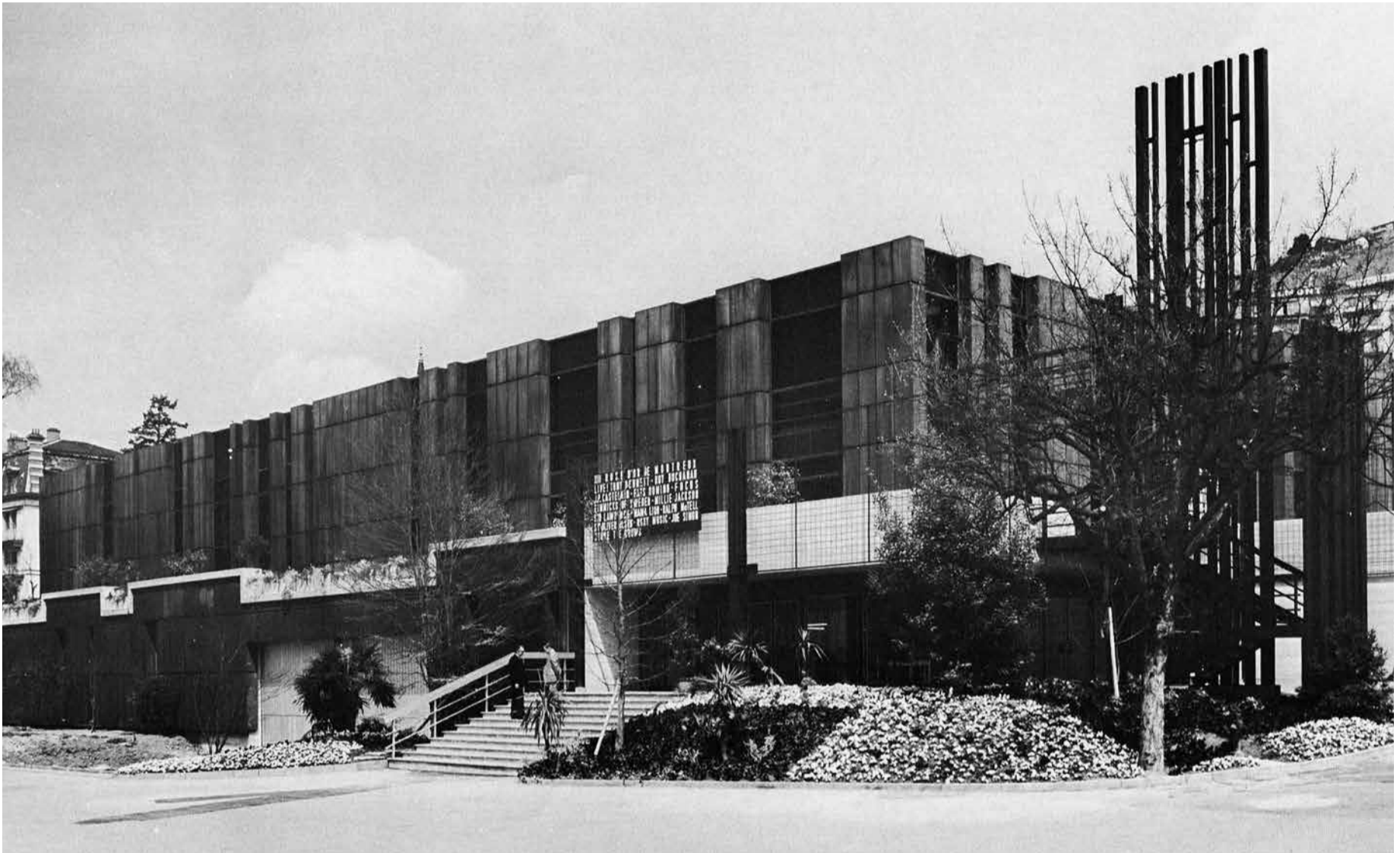
MAISON DES CONGRÈS À SON OUVERTURE EN 1973