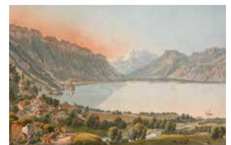
LE LAC LÉMAN, 18 È SIÈCLE