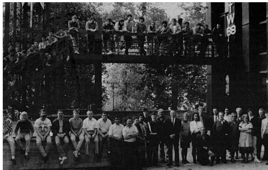
PHOTO DE FAMILLE DES EMPLOYÉS DE LA MAISON DES CONGRÈS LORS DU TTW EN 1988

«Durant ma carrière au 2m2c, j'ai eu l'énorme chance de pouvoir assister à 1'700 concerts tous aussi beaux les uns que les autres. S'il y en a un que je rêverais de voir, ce serait Le Sacre du Printemps à l'Auditorium Stravinski, Igor Stravinski a écrit ce morceau à Montreux en 1912, ce serait lui faire honneur que de le jouer dans cette incroyable salle.»