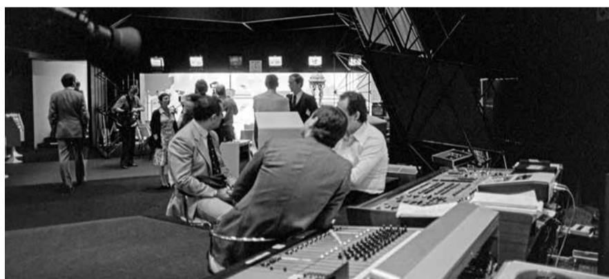
SYMPOSIUM DE L'AUDIO-VISUEL PROFESSIONNEL

L'aspect le plus frappant sur ces 45 dernières années, c'est surtout l'évolution des tâches des responsables d'événements. A l'époque où l'Office de tourisme de Montreux était en charge de la Maison des Congrès, certains événements étaient organisés de A à Z en interne comme par exemple le Symposium de Télévision, le Travel Trade Workshop ou encore Space Commerce. Par la suite, le travail des équipes a évolué vers plus de responsabilités quant à l'aide à l'organisation en faisant des propositions d'excursion ou en réservant les chambres d'hôtels pour les congressistes. Actuellement le service événements a plus un rôle de consultant pouvant conseiller les organisateurs sur les différents aspects à prendre en considération pour faire de leur événement à Montreux un réel succès!