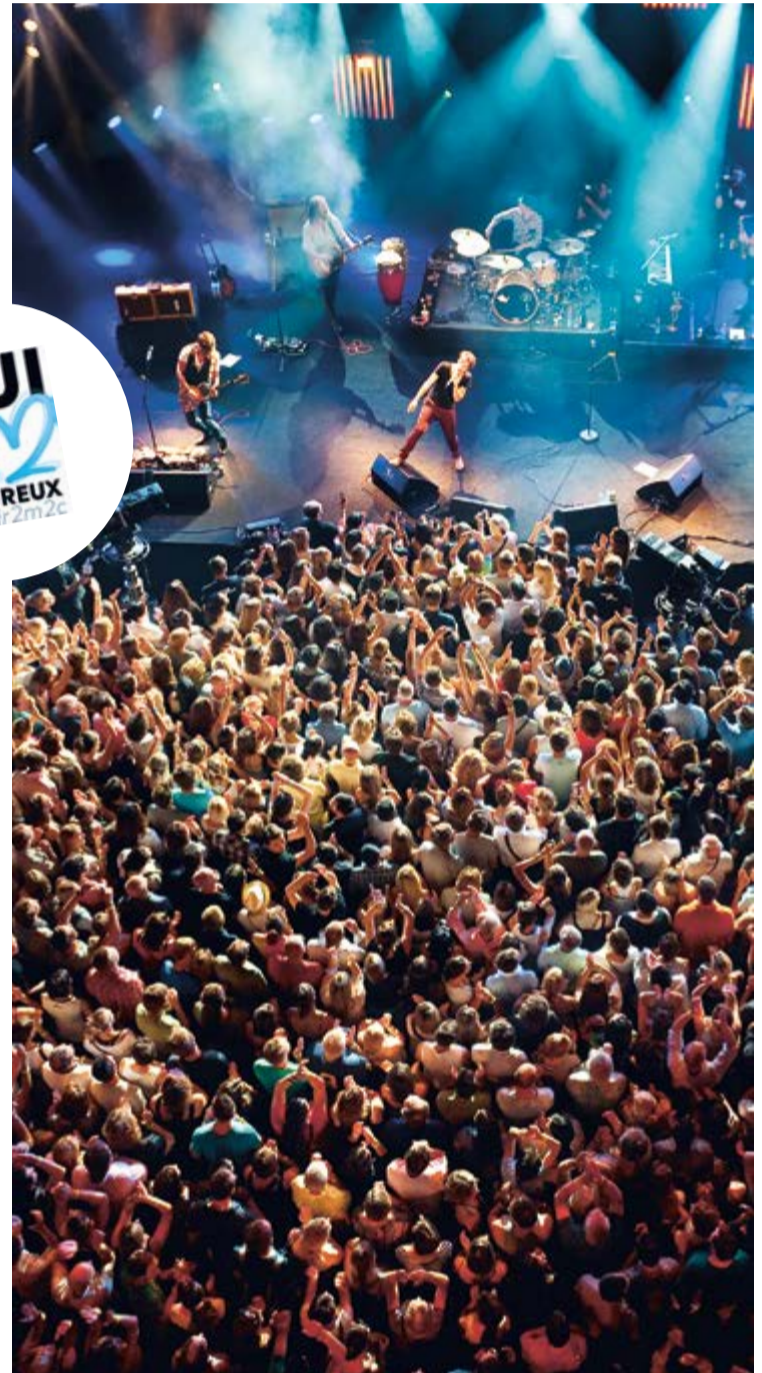
CONCERT DE PAOLO NUTINI LORS DU MONTREUX JAZZ FESTIVAL 2011