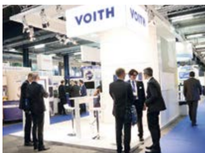
EXPOSITION AU CONGRÈS HYDRO

Les retombées d'un tel congrès ont été très importantes pour la ville mais aussi le canton car en plus des 3'000 nuitées réservées entre Vevey et Montreux, ce sont également des visites sur plusieurs sites d'importance tels que le Chaplin's World, les vignobles de Lavaux ou le barrage d'Émosson qui ont été organisées.