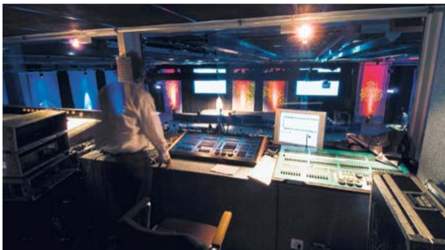
RÉGIE MILES DAVIS HALL

Ces 3 secteurs travaillent conjointement avec pour objectif final de faire rayonner les événements accueillis, la destination Montreux-Riviera et le 2m2c.