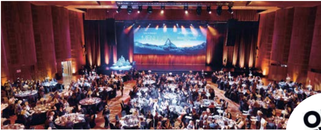
SOIRÉE DE GALA - CONGRÈS BARD, 2017