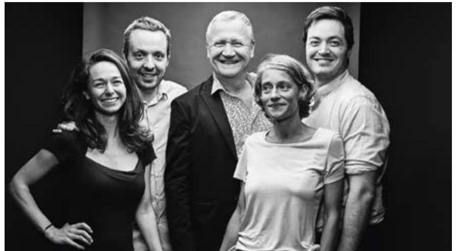
DÉPARTEMENT MARKETING & VENTES

« Notre rôle est de s'assurer que tout soit en place et fonctionne afin que les artistes et nos clients qui se produisent au 2m2c soient pleinement satisfaits. »