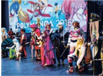
COSPLAYERS DE POLYMANGA

(ils étaient près de 45'000 personnes en 2018) viennent habillés comme leur héros préféré à Montreux. Sur une période de 4 jours, beaucoup d'activités sont ainsi proposées à ces fans de 7 à 77 ans: conférences, séances de dédicaces, concerts, concours de Cosplay, découverte de nouveaux jeux en avant-première ou encore session shopping made in Japan.