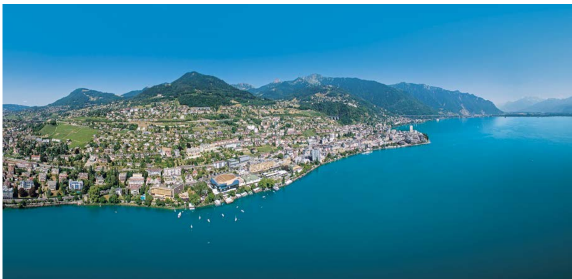
VUE PANORAMIQUE DE MONTREUX RIVIERA

FOCUS SUR UN PARTENAIRE PRIVILÉGIÉ DU CENTRE DE CONGRÈS & MUSIQUE DE MONTREUX