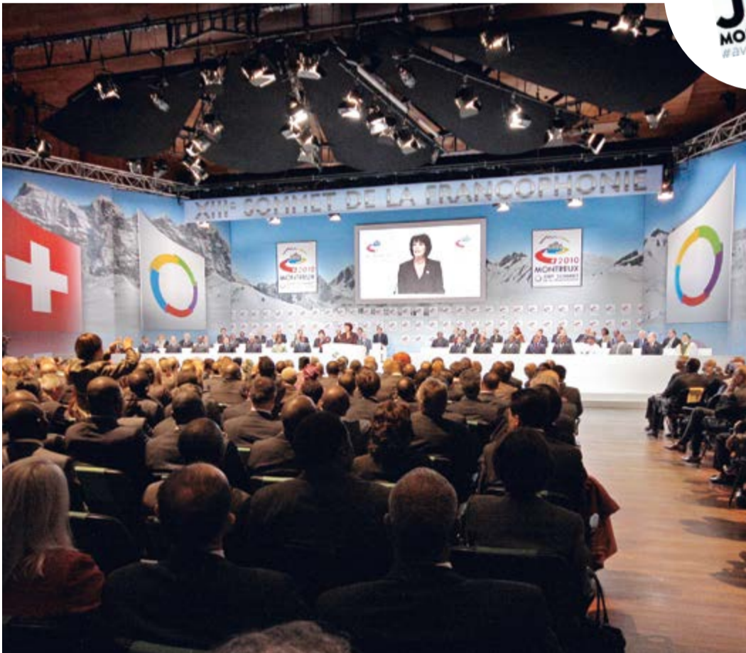
DISCOURS D'OUVERTURE DU XIII e SOMMET DE LA FRANCOPHONIE PAR DORIS LEUTHARD, PRÉSIDENTE DE LA CONFÉDÉRATION, 2010