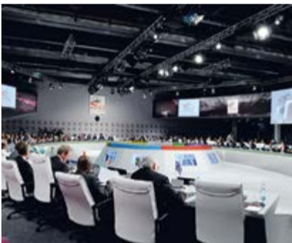
XIII E SOMMET DE LA FRANCOPHONIE

C'est ainsi que Montreux accueillit du 22 au 24 octobre 2010 le XIII e Sommet de la Francophonie, une première sur le sol helvétique. Plus de 1'600 délégués ont représenté 56 pays membres et 14 pays observateurs invités dont 38 chefs d'État et de gouvernement. Le 2m2c fut le centre où se sont tenues toutes les conférences et les pourparlers relatifs à l'éducation, la sécurité alimentaire, le climat et la place des pays francophones dans les instances internationales. Le centre de la fête s'est tenu lui sur la Place du Marché où une cinquantaine de chalets ont été animés par 25 pays et 30 associations. On y organisa également plus de 50 concerts et spectacles en hommage à la Francophonie. L'une des révolutions de ce Sommet a été que les Chefs d'États se sont déplacés à pied ou encore en transports en commun entre leur hôtel et le 2m2c.