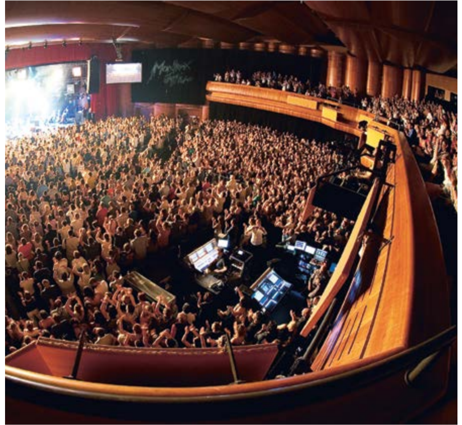
CONCERT PENDANT LE MONTREUX JAZZ FESTIVAL